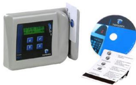
Relógio de ponto

Atualmente, a maioria dos trabalhadores assina um cartão de ponto, onde registram o horário que entram e saem da empresa. O tempo trabalhado está diretamente relacionado com o salário que recebem após o cálculo de crédito e débito de horas.